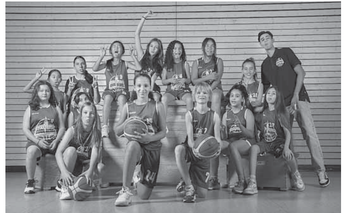
Unsere U12 weiblich

Durch den Hype, den das 3 x 3 Streetballturnier der Damen bei Olympia ausgelöst hat, bieten wir 1 x Woche einen 3 x 3 Abend an. Hier kann man einfach kommen, mit anderen Spielerinnen und Spielern ein Team bilden und dann bei cooler Musik etwas zocken. Ideal für Spielerinnen und Spieler, die dem Ligabetrieb nicht so viel abgewinnen können und trotzdem am Ball bleiben wollen.