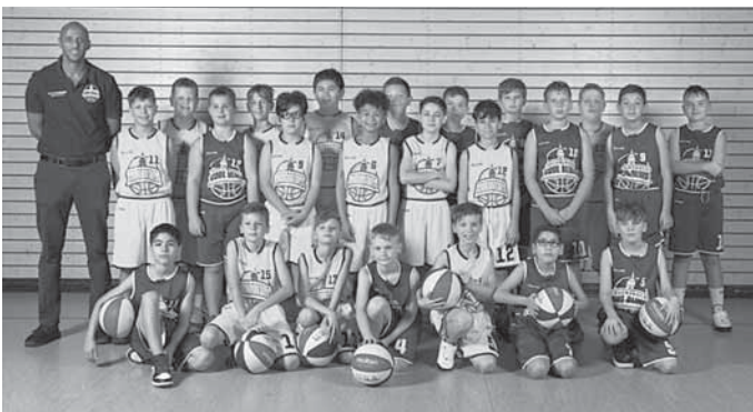
Unsere U12 männlich

Falls Du zu den Größten in Deinem Jahrgang zählst, solltest Du unbedingt vorbeischaun