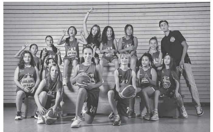
Unsere U12 weiblich

Durch den Hype, den das 3 x 3 Streetballturnier der Damen bei Olympia ausgelöst hat, bieten wir 1 x Woche einen 3 x 3 Abend an. Hier kann man einfach kommen, mit anderen Spielerinnen und Spielern ein Team bilden und dann bei cooler Musik etwas zocken. Ideal für Spielerinnen und Spieler, die dem Ligabetrieb nicht so viel abgewinnen können und trotzdem am Ball bleiben wollen.