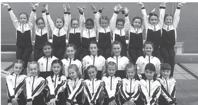
Nachwuchsturnerinnen des TSV Lippoldsweiler zeigen tolle Leistungen und sichern sich Tickets für das Bezirksfinale