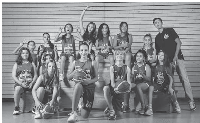
Unsere U12 weiblich

Durch den Hype, den das 3 x 3 Streetballturnier der Damen bei Olympia ausgelöst hat, bieten wir 1 x Woche einen 3 x 3 Abend an. Hier kann man einfach kommen, mit anderen Spielerinnen und Spielern ein Team bilden und dann bei cooler Musik etwas zocken. Ideal für Spielerinnen und Spieler, die dem Ligabetrieb nicht so viel abgewinnen können und trotzdem am Ball bleiben wollen.