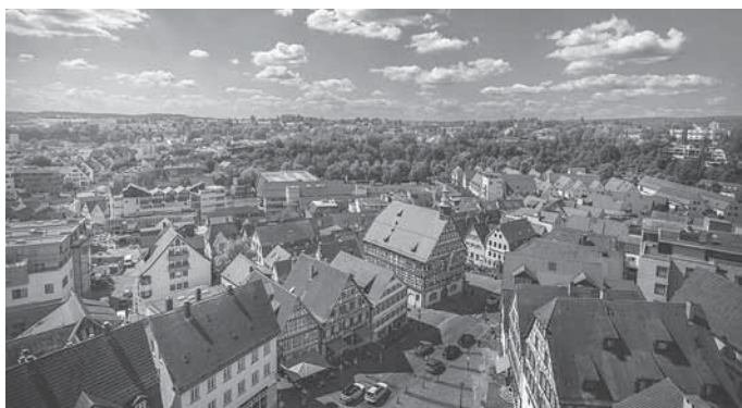
Überblick über Backnang

Anfragen für individuelle Gruppenführungen werden ebenfalls gern entgegengenommen und können per E-Mail oder Telefon gestellt werden.