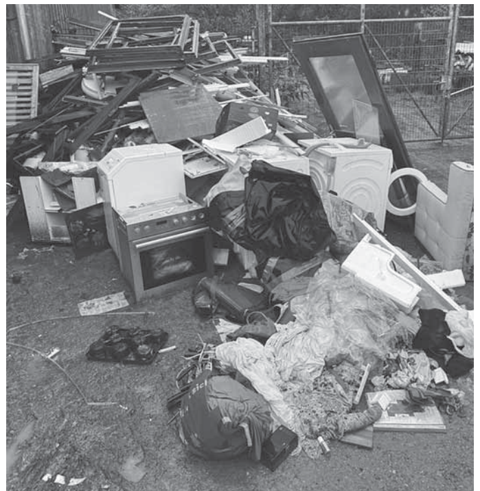
Ein aktuelles Beispiel für illegale Müllentsorgung im Backnanger Stadtgebiet zeigt die Dimension des Problems.

Alternativ können Sie auch ganz einfach den städtischen Mängelmelder nutzen: www.backnang.de/maengelmelder .