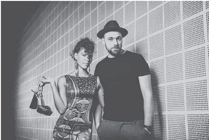
Max Mutzke & Marialy Pacheco im Backnanger Bürgerhaus

Die Ticketpreise beginnen bei 34,- Euro, ermäßigt bei 30,- Euro. Die Tickets können unter www.backnanger-buergerhaus.de gebucht, ihre Verfügbarkeit unter 07191 894-567 und buergerhaus@backnang.de abgefragt werden. Die Abendkasse vor dem Konzert am Donnerstag öffnet um 19.15 Uhr.