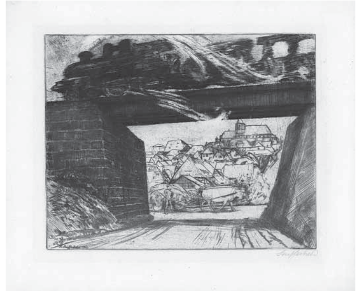
Heinrich Seufferheld, Alte und neue Zeit, Radierung, 1912, Leihgabe: Weibertreumuseum Weinsberg

technischen Infrastruktur: Gleise schneiden als lineare Strukturen durch die Landschaft, Stromleitungen und Industrieanlagen werden zu prägnanten Bildmotiven.