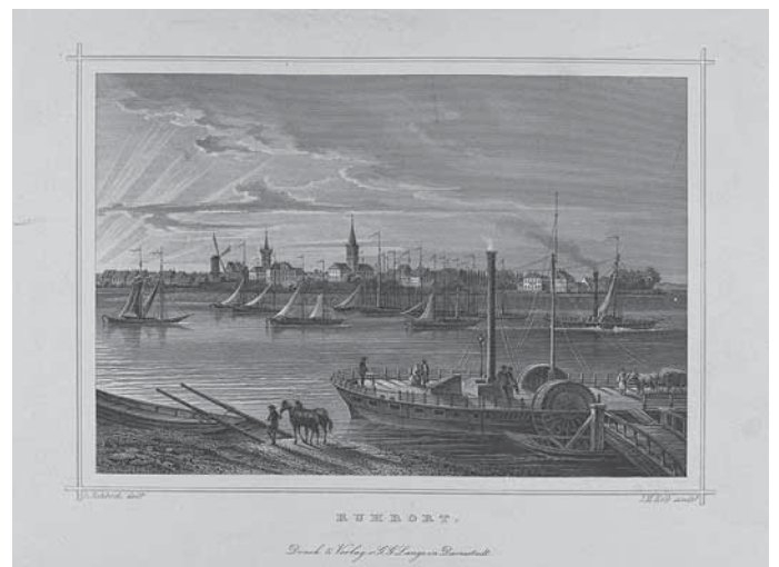
Joseph Maximilian Kolb, Ruhrort, Mitte 19. Jahrhundert, Stahlstich

Der Eintritt in die Ausstellung ist frei. Die regulären Öffnungszeiten des städtischen Graphik-Kabinetts sind Dienstag bis Freitag von 16.00 bis 19.00 Uhr sowie Samstag von 11.00 bis 18.00 Uhr und Sonntag von 14.00 bis 18.00 Uhr.