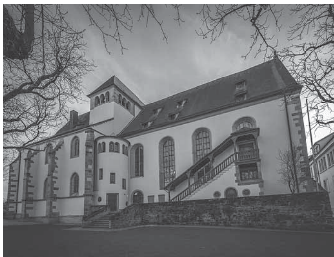
Stiftskirche und Freithof

Am Sonntag, 8. März 2026, findet um 16.00 Uhr die Führung Frauen in Backnang statt. Die Führung dauert 120 Minuten, beginnt am Stiftshof und kostet 7,- Euro.