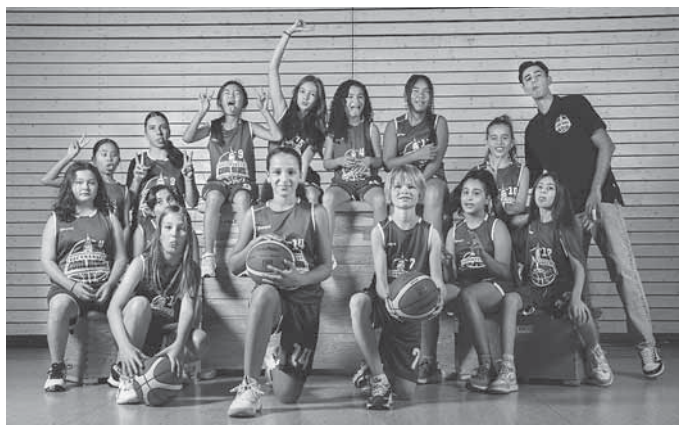
Unsere U12 weiblich

Durch den Hype, den das 3 x 3 Streetballturnier der Damen bei Olympia ausgelöst hat, bieten wir 1 x Woche einen 3 x 3 Abend an. Hier kann man einfach kommen, mit anderen Spielerinnen und Spielern ein Team bilden und dann bei cooler Musik etwas zocken. Ideal für Spielerinnen und Spieler, die dem Ligabetrieb nicht so viel abgewinnen können und trotzdem am Ball bleiben wollen.