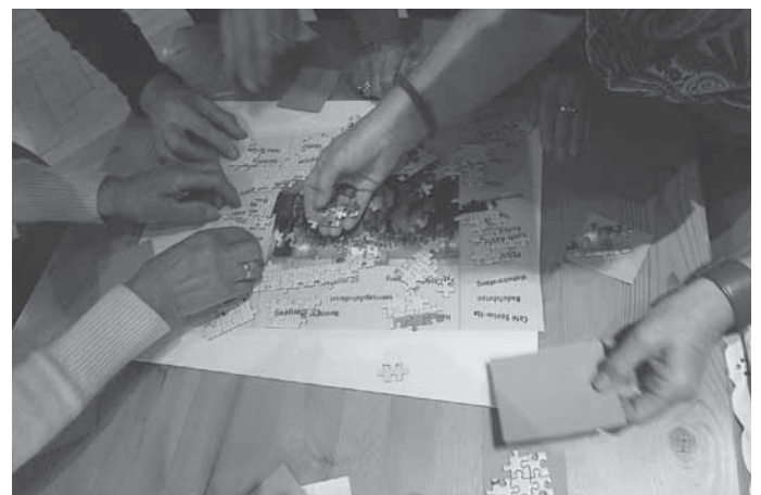
Mit jedem Puzzleteil wuchs das gemeinsame Bild, Symbol für Zusammenhalt und Vielfalt.

Die 26 Projekte des Seniorenbüros werden derzeit von 116 Ehrenamtlichen organisiert und begleitet. Die Altersstruktur beläuft sich zwischen 45 und 93 Jahren. Nahezu gleich viele Männer und Frauen engagieren sich im Seniorenbüro ehrenamtlich. Dabei zählt jede und jeder Einzelne, egal in welchem Bereich er oder sie sich einbringt und wie viel Zeit investiert werden kann oder möchte. Alle Anwesenden erhielten die Aufgabe, sich im Laufe des Nachmittags an einem gemeinsamen Puzzle zu beteiligen, auf dem die Projekte dargestellt sind. Am Ende des Nachmittags war das Bild komplett. Dieses ist nun im Seniorenbüro aufgehängt und kann dort betrachtet werden.