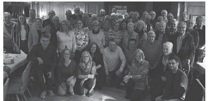
Die Ehrenamtlichen der 26 Projekte des Seniorenbüros beim Jahrestreffen unter dem Motto „Wenn Sie nicht dabei wären, würde uns etwas fehlen“.

Beim Stichwort Puzzle fallen einem viele Metaphern ein: „Gemeinsamkeit“, „Vielfalt“, „passgenaue Angebote“ und vieles mehr. Unter dem Motto „Wenn Sie nicht dabei wären, würde uns etwas fehlen“ lud das Seniorenbüro die Ehrenamtlichen zum jährlichen Treffen und gemeinsamen Essen ein. Die Ehrenamtlichen erhielten an diesem Nachmittag viel Zuspruch und Wertschätzung für ihr wertvolles Engagement. Sie schaffen Gemeinsamkeit und ermöglichen in unterschiedlichen Bereichen altersgerechte Angebote.