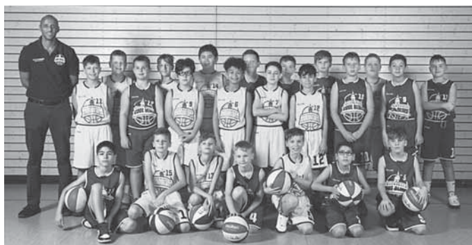
Unsere U12 männlich

Anfragen bitte schriftlich per WhatsApp an die 01567 8 34 91 12