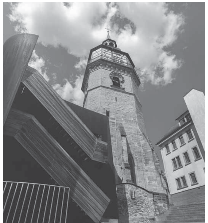
Stadtturm und Treppen am Markgrafenhof

Bei diesem 120-minütigen Stadtspaziergang treppauf und treppab führt die Stadtführerin die Teilnehmerinnen und Teilnehmer über die Stäffeles durch Backnang. Dieser Stadtspaziergang ist eine einzigartige Kombination aus Stadtgeschichte(n), Kultur und Natur. Das lässt sich – treppauf und treppab – am besten zu Fuß erwandern und erleben.