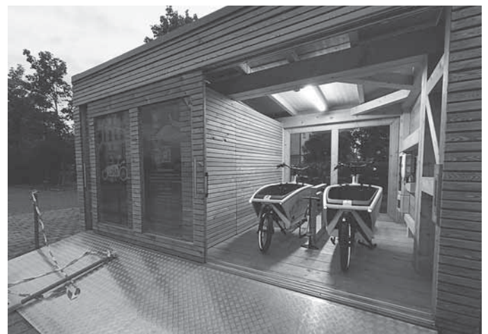
Die beiden LaRas in der Maubacher Station (Backnang)

Mehr Informationen unter www.laratogo.de