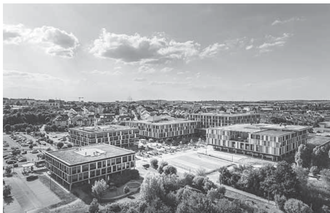
Das Land Baden-Württemberg fördert den Ausbau des Rems-Murr-Klinikums Winnenden zum Pflege-Campus mit über 21 Millionen Euro. Auf der Freifläche zwischen Verwaltungsgebäude (links) und Hauptgebäude (rechts) findet das Bildungszentrum für Gesundheitsberufe (BZG) Rems-Murr seine neue Heimat.

Die Vorbereitung des Baufelds am Klinikum hat bereits begonnen. Der Spatenstich für den Pflege-Campus kann voraussichtlich Ende Mai erfolgen, Haus D könnte damit voraussichtlich Anfang 2028 bezugsfertig sein.