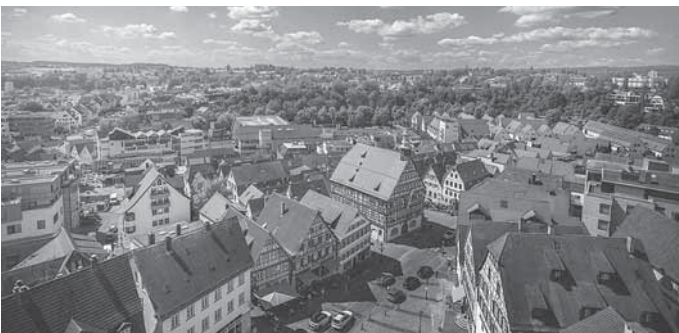
Überblick über Backnang

Bei dieser 90-minütigen Tour durch die verwinkelten Gassen der Innenstadt lässt die Stadtführerin die spannenden Traditionen und Geschichten Backnangs aufleben. Die Teilnehmerinnen und Teilnehmer erfahren dabei mehr über die abwechslungsreiche und beeindruckende Geschichte der Fachwerkstadt.