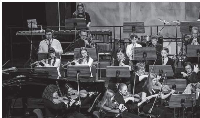
Musikerinnen und Musiker der Jugendmusik- und Kunstschule Backnang beim Jubiläumskonzert.

Es erwartet Sie eine Vielzahl an atemberaubenden Musikbeiträgen. Freuen Sie sich bereits jetzt auf unser namhaftes Harfenensemble und unser großes Jugendsinfonieorchester, welches auch dieses Mal wieder ein qualitativ anspruchsvolles Programm präsentieren wird. Zudem freuen sich unsere Blockflöten- und Streicherkids, das Percussion-Ensemble und unsere Gesangssolisten, diesen runden Geburtstag der Jugendmusik- und Kunstschule Backnang mit ihrem Auftritt zu feiern.