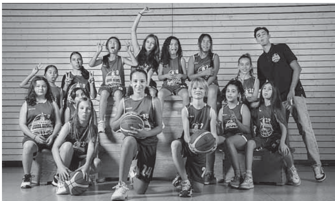
Unsere U12 weiblich