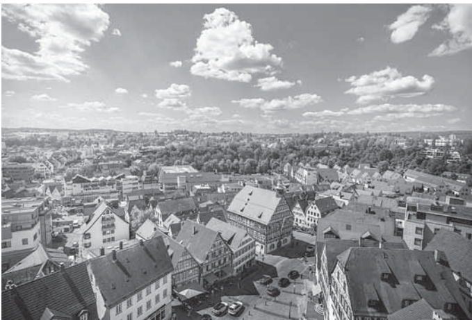
Überblick über Backnang

Bei dieser 90-minütigen Tour durch die verwinkelten Gassen der Innenstadt lässt die Stadtführerin die spannenden Traditionen und Geschichten Backnangs aufleben. Die Teilnehmerinnen und Teilnehmer erfahren dabei mehr über die abwechslungsreiche und beeindruckende Geschichte der Fachwerkstadt.