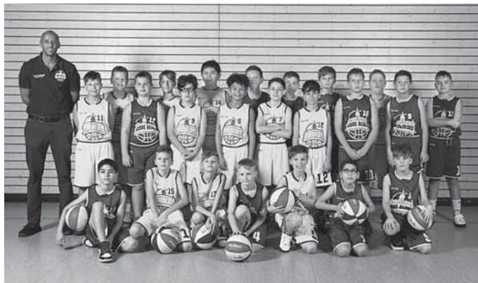
Unsere U12 männlich

Anfragen bitte schriftlich per WhatsApp an die 01567 8 34 91 12