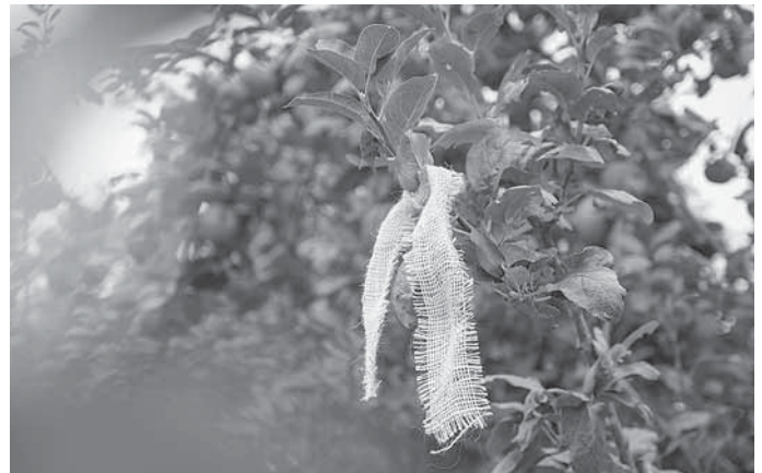
Mit einem gelben Band gekennzeichnete Bäume dürfen von jedermann geerntet werden.

Um die Suche nach freigegebenen Obstbäumen zu erleichtern, steht auch in dieser Saison die Plattform Mostviertelbörse unter www.mostviertelboerse.de zur Verfügung. Dort können Angebot und Nachfrage unkompliziert zusammenfinden – eine wertvolle Ergänzung für all jene, die keine eigenen Bäume besitzen, aber dennoch die Früchte der Region genießen möchten. Diese digitale Vermittlungsbörse wurde im Jahr 2023 im Schulterschluss der Stadt Backnang mit der Geschäftsstelle des Schwäbischen Mostviertels sowie den Partnerkommunen Aspach, Allmersbach im Tal, Auenwald, Sulzbach an der Murr und Weissach im Tal ins Leben gerufen. Möglich wurde die Umsetzung durch die Förderung des Regionalbudgets in der ILE-Region.