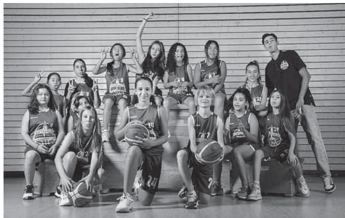
Unsere U12 weiblich

Durch den Hype, den das 3 x 3 Streetballturnier der Damen bei Olympia ausgelöst hat, bieten wir 1 x Woche einen 3 x 3 Abend an. Hier kann man einfach kommen, mit anderen Spielerinnen und Spielern ein Team bilden und dann bei cooler Musik etwas zocken. Ideal für Spielerinnen und Spieler, die dem Ligabetrieb nicht so viel abgewinnen können und trotzdem am Ball bleiben wollen.