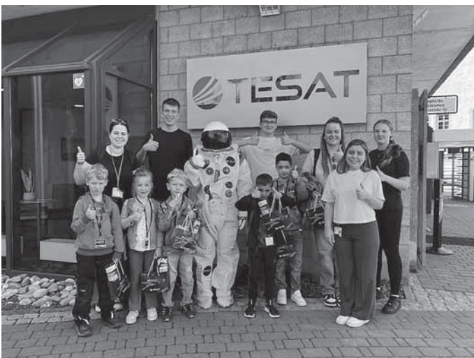
Die Vorschulkinder der Kita Imster Straße entdecken gemeinsam mit den Auszubildenden von Tesat die spannende Welt der Satelliten.

Die Vorschulkinder der Kita Imster Straße durften kürzlich ihren Kooperationspartner Tesat-Spacecom in Backnang besuchen. Bereits im Vorfeld hatten sich die Kinder mit dem Thema Weltall und Satelliten beschäftigt. Azubis von Tesat kamen in die Kita und führten gemeinsam mit den Kindern spannende Experimente durch. Dabei drehte sich alles rund um Satelliten und dem Weltraum und somit bekamen die Vorschulkinder auf spielerische Weise erste Eindrücke, womit sich die Auszubildenden bei Tesat täglich beschäftigen.