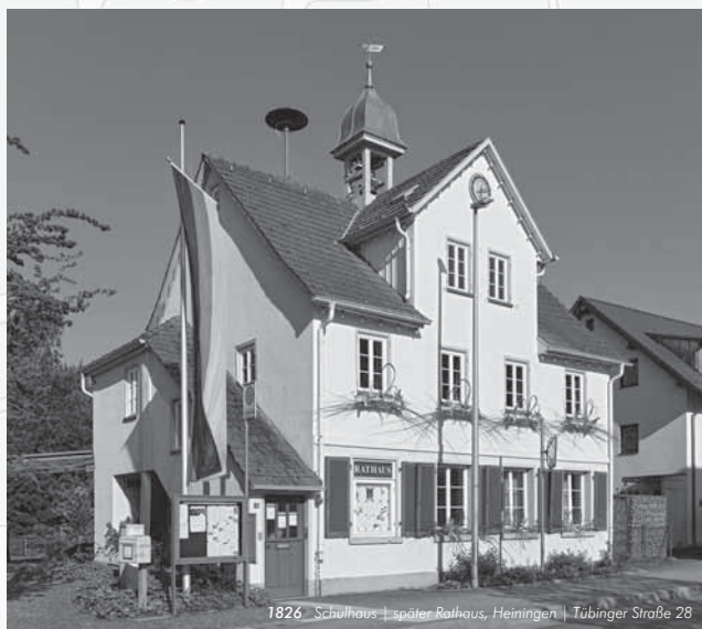
1826 Schulhaus | später Rathaus, Heiningen | Tübinger Straße 28

Herzliche Einladung zum Tag des offenen Denkmals am 14. September 2025 ab 11.00 Uhr in Backnang-Heiningen