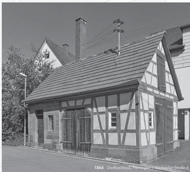
1866 Dorfbackhaus, Heiningen | Marbacher Straße 6