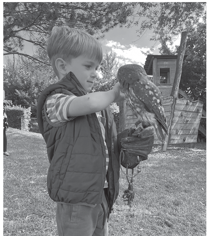
Greifvögel zu Gast im Kindergarten „Paul Reusch“ in Strümpfelbach

Greifvögel zu Gast im Kindergarten „Paul Reusch“ in Strümpfelbach